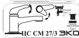
ЦС СМ 27/3 ЭКО