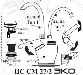
ЦС СМ 27/2 ЭКО

Смеситель для умывальника и мойки однорукоятный центральный наборный, излив с аэратором.